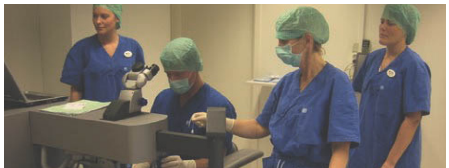
Operationsteamet hos Ögonkirurgi c/o Synsam i Örebro.

– Vi hoppas kunna erbjuda detta i många fler städer redan nästa år, säger hon.