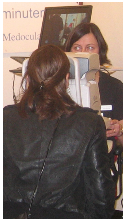
Autorefraktorn var ett populärt inslag i Capiro Medoculars monter.